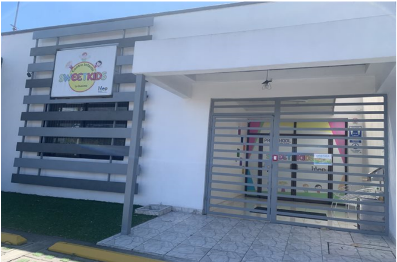
Foto: entrada principal del CI Sweet Kids

Los Estándares Esenciales de la Calidad de la Red de Cuido (REDCUDI) son condiciones esenciales por considerarse en los servicios brindados a la población infantil (desde el nacimiento hasta los 12 años) (Red Nacional de Cuido y Desarrollo Infantil, 2019).