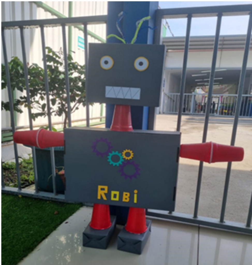
Foto: robot creativo realizado en el Centro Infantil Sweet Kids.

Dentro del proceso desarrollado a nivel pedagógico, se identificó la necesidad de realizar cambios para mejorar en las áreas de formación profesional, estimulación, idiomas y tecnología. En el Centro Infantil Sweet Kids, la capacitación sobre las habilidades y competencias en las áreas STEAM fortaleció el interés en la incorporación de estas temáticas en la formación de los niños y niñas. Al principio, se incorporaron algunos aspectos, pero luego se apostó por incluir su abordaje de manera más constante, al menos una vez a la semana, con clases que utilizaban materiales donados, reciclables y otros. También se buscó la adquisición de tabletas electrónicas para programas específicos en inglés, y surgió el proyecto de tener un laboratorio de cómputo y pantallas interactivas en el futuro.