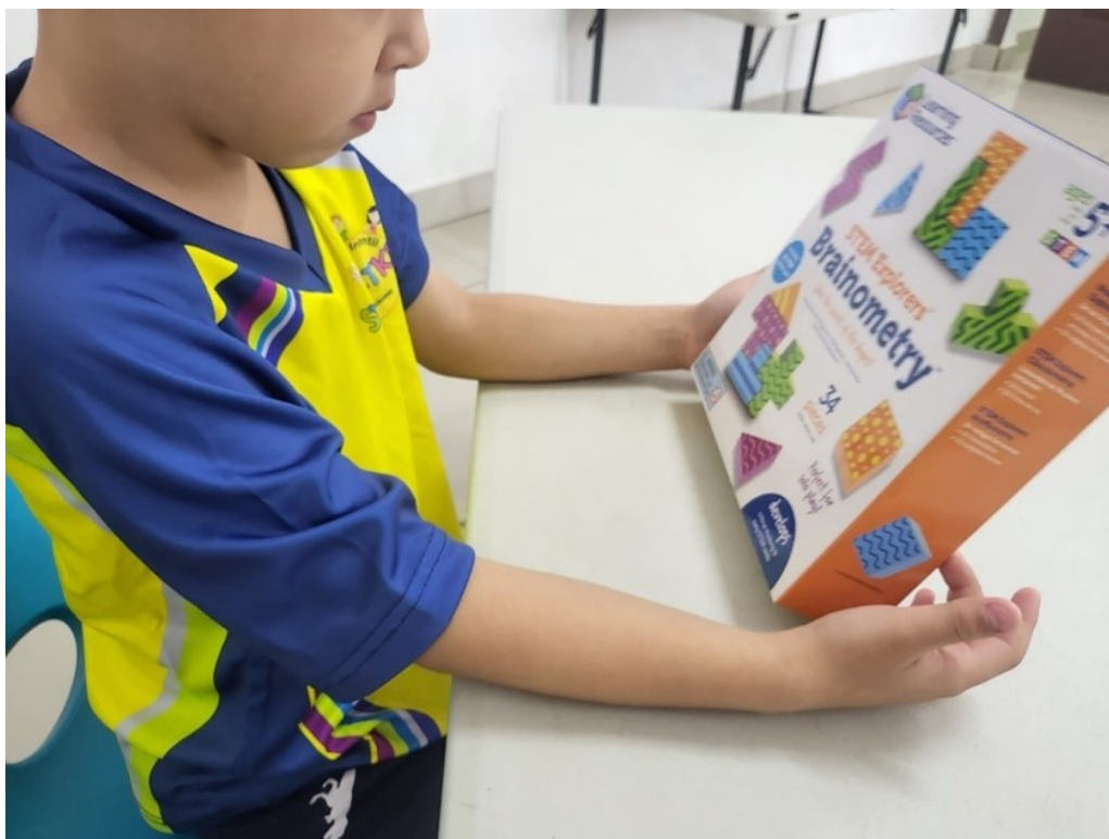
Foto: niño trabajando con material STEAM en inglés