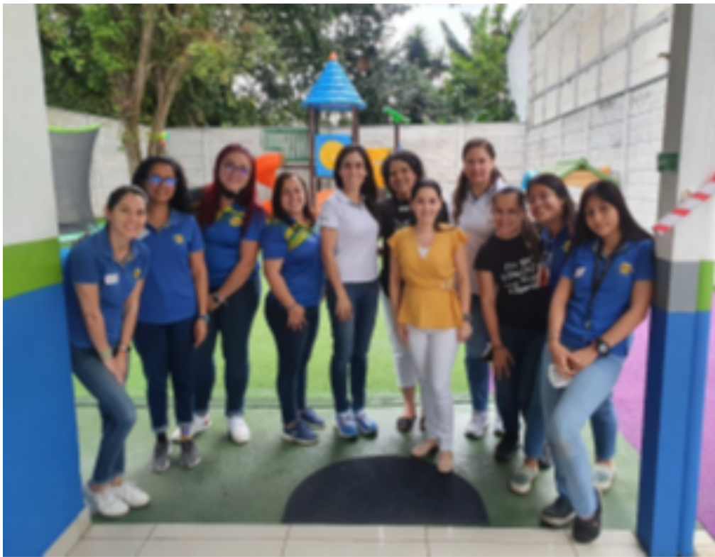
Foto: docentes participando en espacios formativos