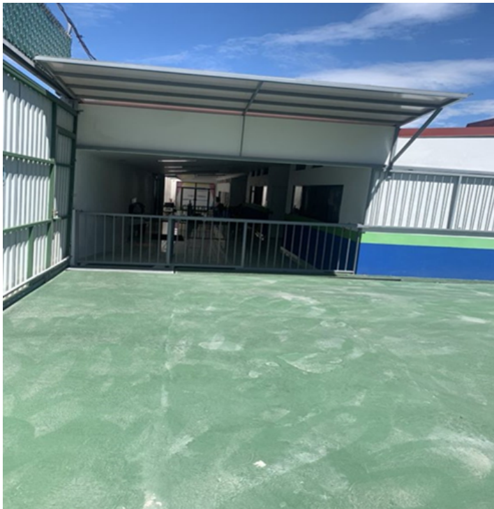
Foto: cambio a césped sintético del Centro Infantil Sweet Kids