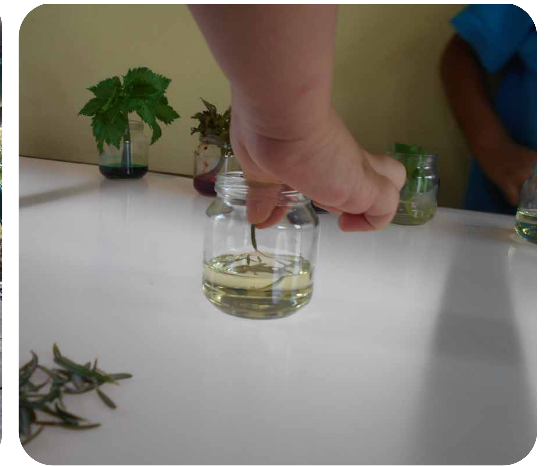
Ismael, Eris y Valentina, 4 años